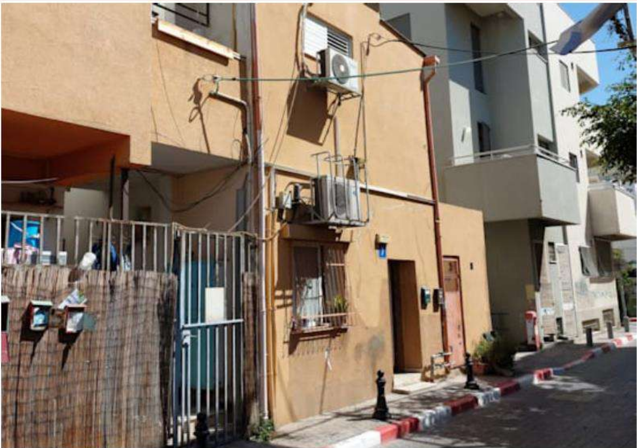
הוד השרון: לופט בן 5 חדרים ב-4.87 מיליון שקל