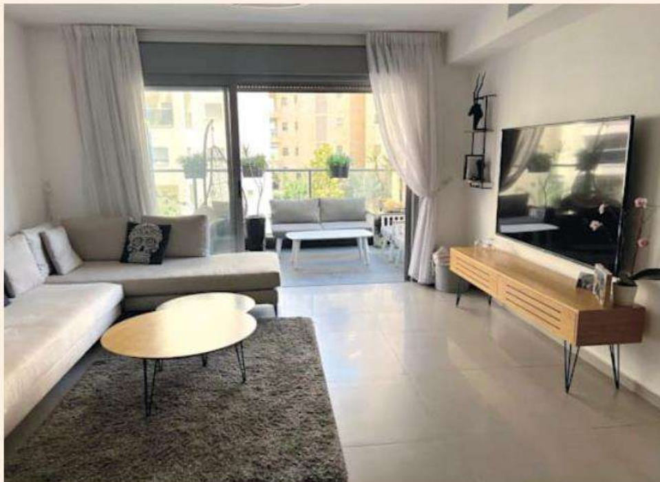
סלון הדירה ברחוב עוזי חיטמן בחולון

לדבריו, "השכונה ממוקמת בדרום העיר, במרחק קילומטר נמצא קניון חולון והשכונה קרובה ונגישה לצירי תחבורה ציבורית לרבות תחנה של הקו הירוק העתידי".